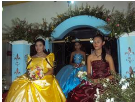
Flores de Mayo Festival